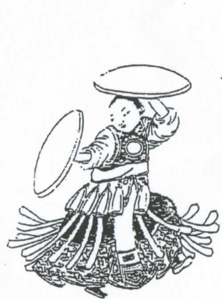
滿族薩滿耍鼓模樣

乩童流血性質的表演，主要用七星劍、沙魚劍、狼牙棒、月眉斧、刺球等法器，表演割舌刺骨、砍背劈額，鮮血淋漓，狂舞亂吼，這是乩童的主要特色。薩滿也有上刀梯等考驗方式，但它是以不流血性質的表演為主。薩滿法術的象徵，主要為薩滿的法器及神服，薩滿跳神治病時所使用的神鼓及銅鏡等飾物，不僅是薩滿的外部標誌，而且也是薩滿巫術法力的象徵，缺乏法器、神服，薩滿就無所施其神術。乩童與薩滿確實有許多共同特徵，但也有許多差異，為了突顯乩童的特徵，除了真正崇奉薩滿信仰的北亞地區外，臺灣的乩童，確實不應歸屬於北亞薩滿信仰系統。