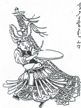
滿族薩滿迎神模樣