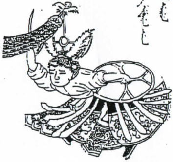
滿族薩滿跳老虎神模樣

Handwritten Manchu script in vertical columns, representing the first page of a manuscript from the 'Nishan Shamanic Legend'.